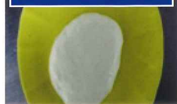
④ちょうど良い硬さ、香ばしく米の風味もちょうどよい