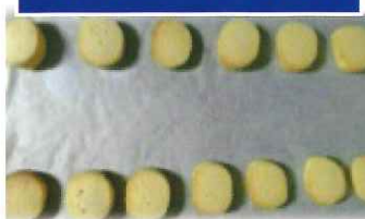
③②より若干ひび割れが解消された