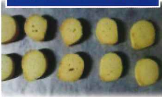
②ひび割れが少なくなった