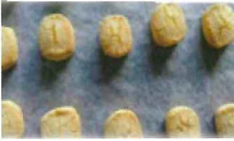
①全体的にひび割れが生じた