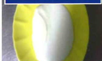
③米の味と風味が強い