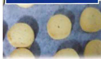
④ひび割れが解消され、α米粉の香ばさを感じる